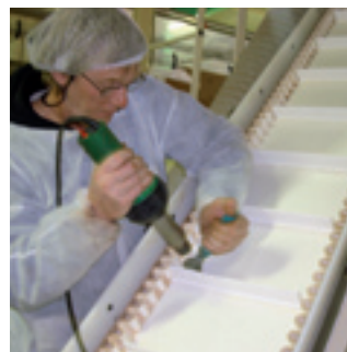
Collage de tasseaux sur bande chocolat