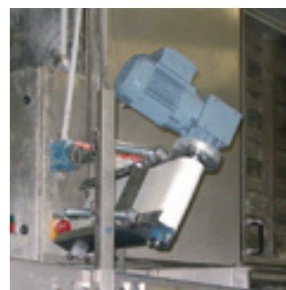
Convoyeur modulable sur axe pivotant