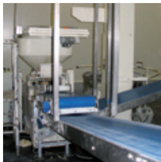
Fourniture d'un convoyeur en inox alimentaire avec tambour moteur intégré

Optimiser vos lignes de production pour gagner en efficacité.