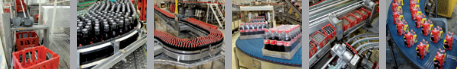
Clamart - Chaîne à palette sur zone d'embouteillage - Convoyeur à bande sur pente - Convoyeur courbe 90°. Fourniture et remplacement de pièces et accessoires : roulements, rouleaux, tambours, courroies..