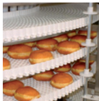
Installation d'un convoyeur hélicoïdal avec bande modulaire résistante aux huiles et graisses

7 jours sur 7 24 h sur 24 365 jours par an.